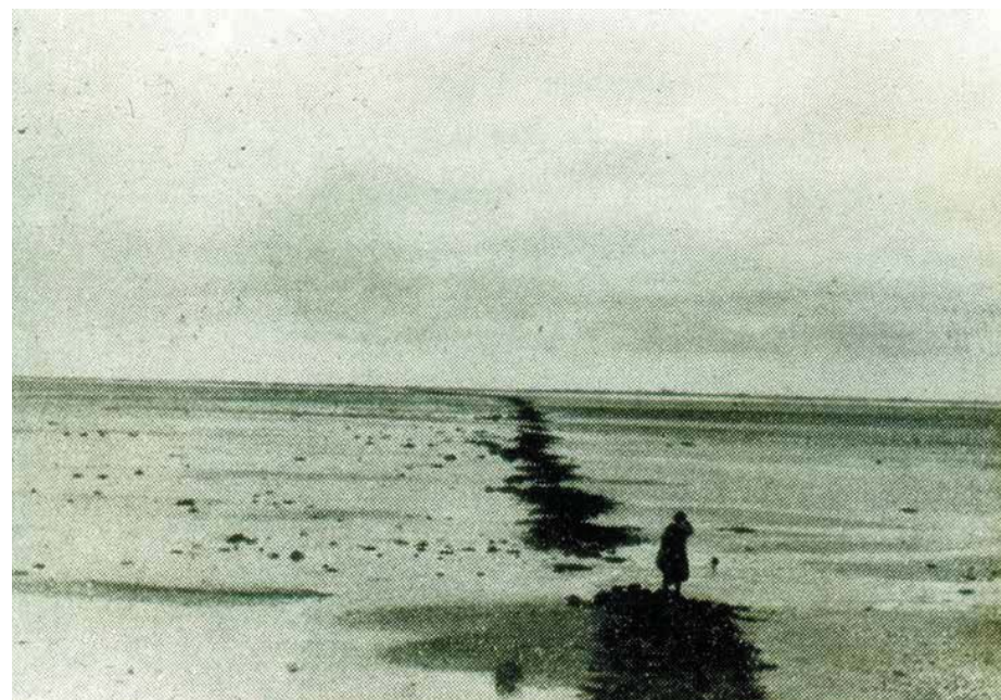
Overblijfselen van de dam bij laagwater.

Dat laatste kan hij niet ongezegd laten. Van beide bankiers heeft hij nog geen woord van waardering ontvangen over zijn inzet om de dam zo hoog op te werken. Zoveel hoger dan de maat die de concessie verplicht.