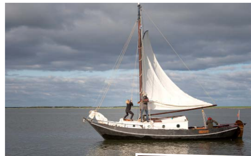
boven: De grundel met midzwaard blijkt al snel een makkelijk hanteerbaar schip