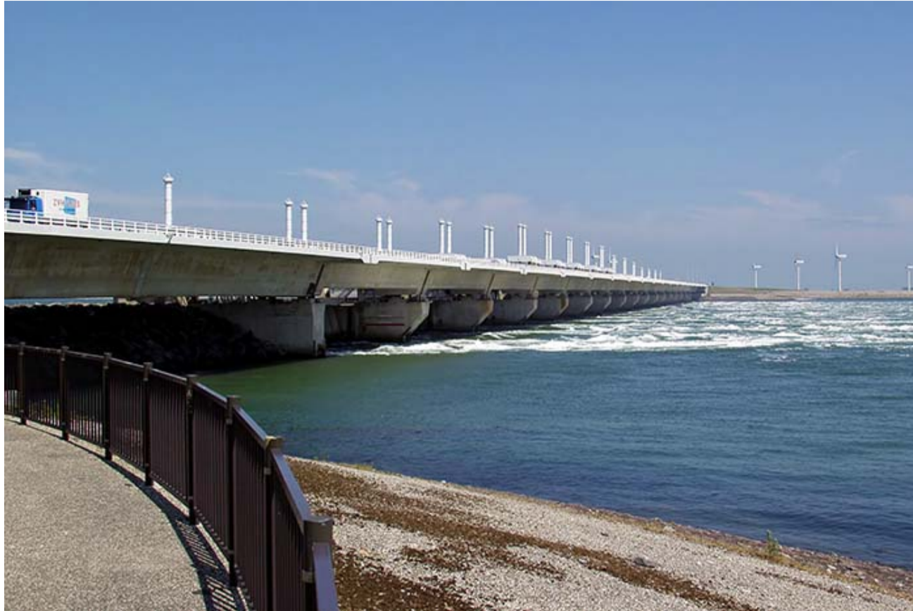
Raimond Spekking, Deltawerken Oosterschelde (2004). Bron: Wikimedia Commons (CC BY-SA 4.0)

zelfs hun overleden dierbaren niet begraven op het kerkhof dat de ramp wel overleefde. Vanzelfsprekend was dat voor hen ontzettend pijnlijk.”