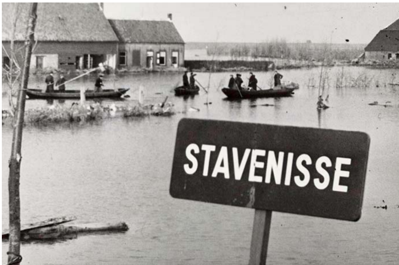
Ook het Zeeuwse dorp Stavenisse was overstromd.