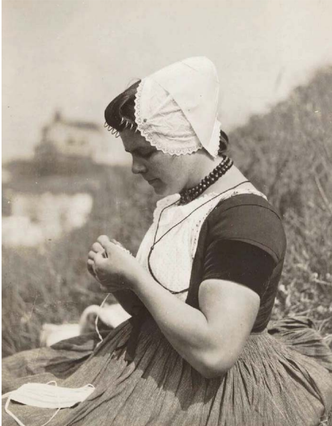
Dit beeld, een boerin in klederdracht die in haar vrije tijd een handwerkje doet aan het strand, werd langzaam verleden tijd.