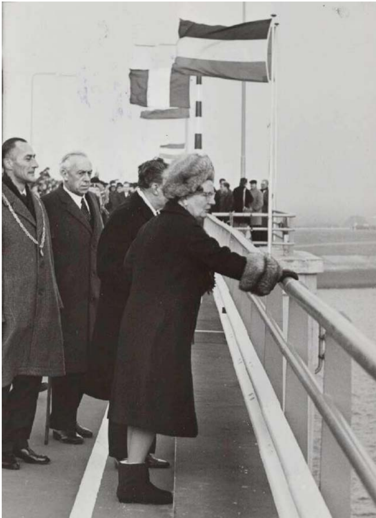
Eric Koch, Koningin Juliana heeft de Oosterscheldebrug geopend (1965). Bron: Nationaal Archief/Anefo (PD)

Ook het landschap op de eilanden veranderde ingrijpend. "Zeeland had voor de ramp nog veel kleine stukjes land, met kronkelweggetjes en bomen", vertelt Nijenhuis. "Na de ramp werd met de herverkaveling alles strakgetrokken, er ontstond een compleet nieuw landschap."