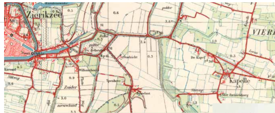
Kapelle (Capelle) op de topografische kaart van 1953.

Vreeswijk dicht; de 30 kilometer lange afgedamde Rijn tussen Wijk bij Duurstede en Utrecht heette voortaan de Kromme Rijn. De stad kreeg een nieuwe verbinding met de Lek dankzij de Vaartsche Rijn, zodat schepen Utrecht konden blijven bereiken. Na de afdamming bleef het