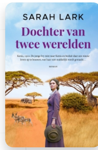
Dochter van twee werelden Sarah Lark ★★★★☆