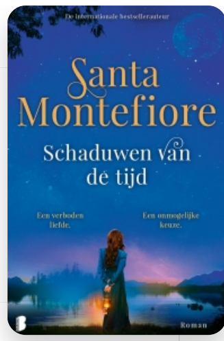
Schaduwen van de tijd Santa Montefiore ★★★★★